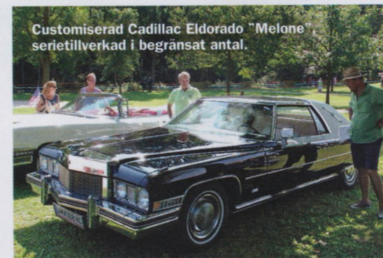
Customiserad Cadillac Eldorado "Melone" serietillverkad i begränsat antal.