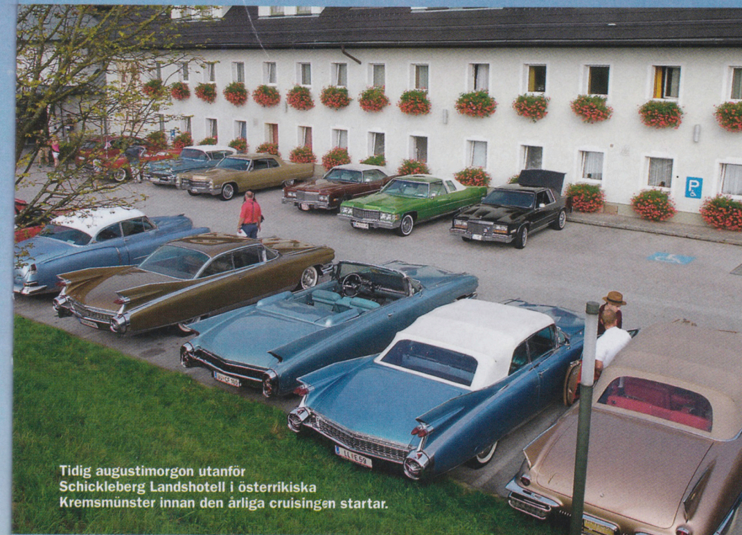
Tidig augustimorgon utanför Schickleberg Landshotell i österrikiska Kremsmünster innan den årliga cruisingen startar.

Att man fastnat för just Kremsmünster beror främst på dess vackra läge på landsbygden ▶