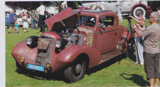
Klart avvikande i parken var Sepp Weinzetis Cadillac Coupe 1934 med kompressormatad Chev454 V8. Och ännu mer uppseendeväckande var den samling Lincoln Zephyr coupéer och Cadillac coupéer från 30-talet samt märkliga hot rods och klassiska trimningstillbehör som Sepp senare visade oss hemma i sitt spektakulära garage.