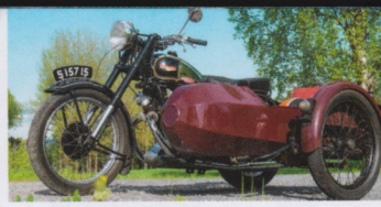
Panther x 2