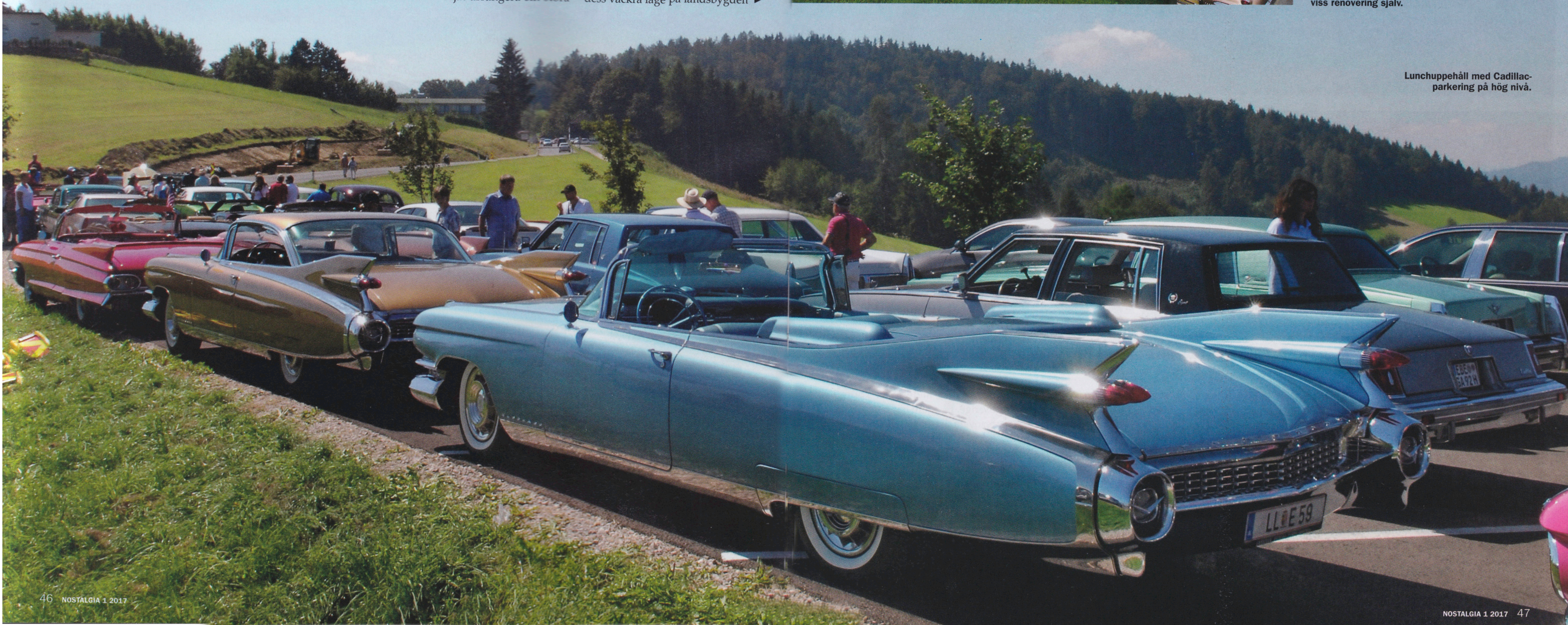
Lunchuppehåll med Cadillacparkering på hög nivå.