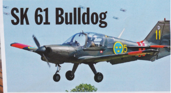
SK 61 Bulldog

Prins August • Airstream Safari • Cadillac Big Meet i Alperna