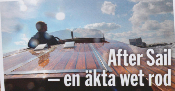
After Sail — en äkta wet rod