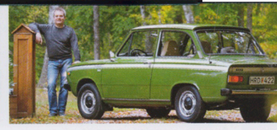
Daf 66 Marathon

NR 1 2017 PRIS 69,- DANMARK 65 DKK, NORGE 79 NOK, FINLAND 7,50 EURO, INKL. MOMS.