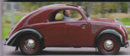
Steyr 55 – den udda folkbilen