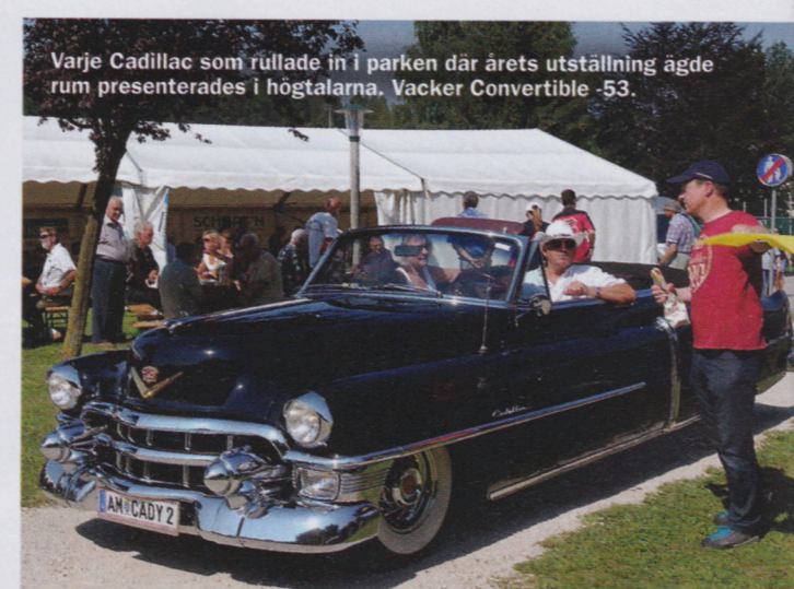
Varje Cadillac som rullade in i parken där årets utställning ägde rum presenterades i högtalarna. Vacker Convertible -53.